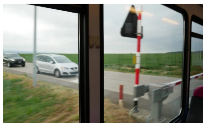
COVID-19 : L'enquête Mobilité